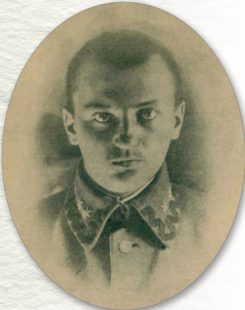
Porucznik Leopold Kula – oficer I Brygady Legionów Polskich (Juliusz Kaden-Bandrowski, Leopold Lis-Kula – pułkownik , Warszawa 1937)

piechoty walnie przyczynił się do uratowania drogi odwrotowej batalionu przez wieś Wołczeczek, zagrożonej atakami kawalerii rosyjskiej. Straty przeciwnika, poniesione tego dnia w wyniku działań oddziału pod komendą Lisa, oceniano na 11 szwadronów jazdy. W kolejnych