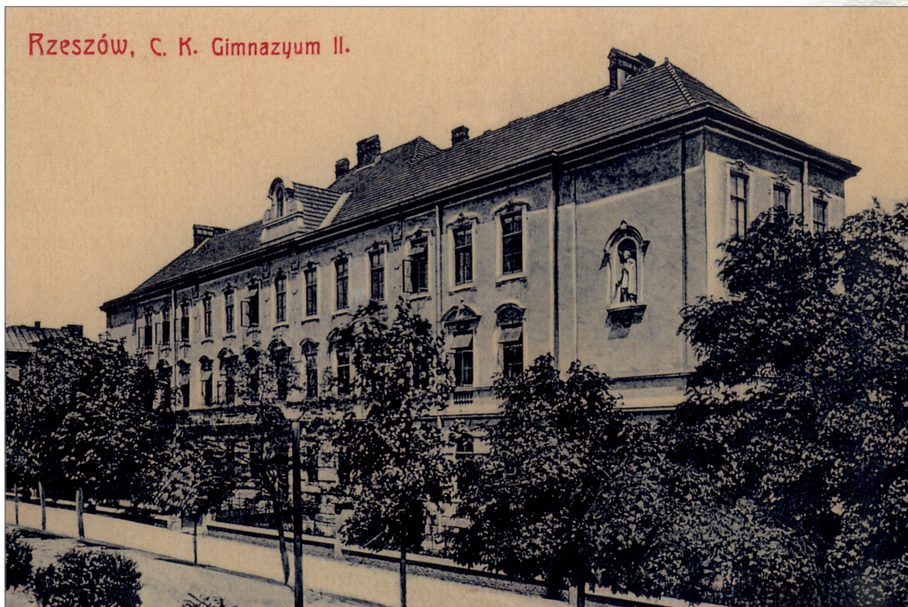
II Gimnazjum w Rzeszowie

„Promień”, zakładał samokształcenie, w ramach którego kładziono nacisk na znajomość literatury narodowej, historii Polski. W programie był też postulat zajęcia się losem warstwy chłopskiej.