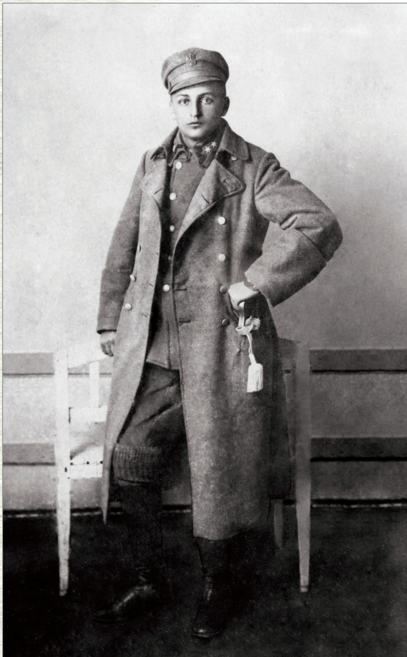
Leopold Lis-Kula w Legionach Polskich