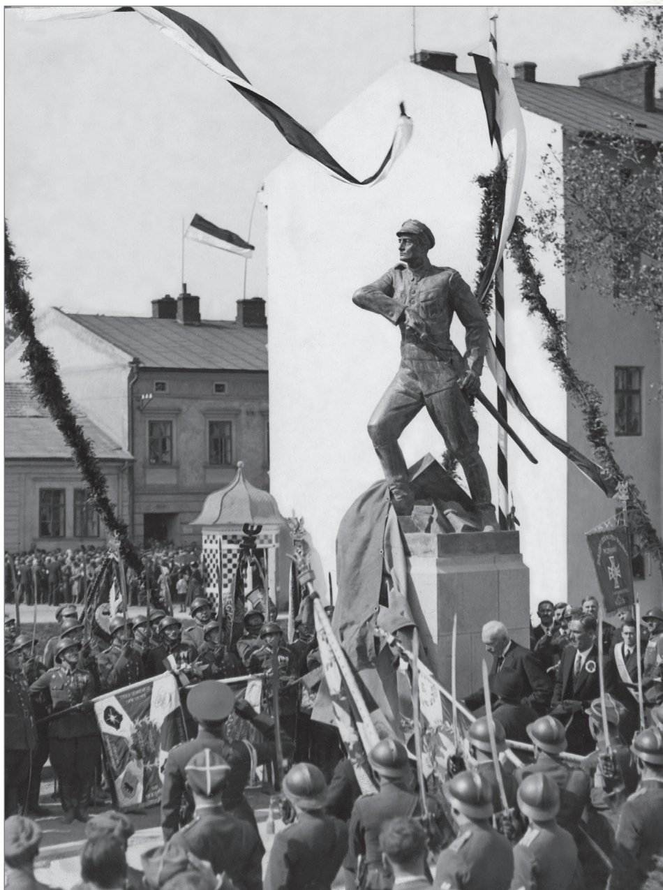
Prezydent Ignacy Mościcki odsłania pomnik Leopolda Lisa-Kuli w Rzeszowie, 18 września 1932 r.